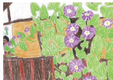
大賞作品 (高学年の部)

コンセントをこまめに抜く、冷房の代わりに扇風機を使用するなど、従業員にとって節電を意識するきっかけになっただけでなく、参加者からは「家庭内のコミュニケーションに役立った」との声も聞かれました。